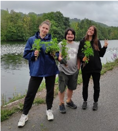
Nos trois stagiaires après arrachage complet d'une petite population

L'année 2020, si particulière, était pour l'Observatoire wallon des ambrosies une année très chargée. Communication et sensibilisation, recensement de terrain, organisation de formation, actions de lutte... de l'aide était évidemment la bienvenue ! Trois étudiants en fin d'études de master ont choisi notre structure pour réaliser leur stage, et cela nous a bien aidé – malgré les évidentes adaptations que nous avons dû apporter à l'organisation pour faire face à la crise COVID-19.